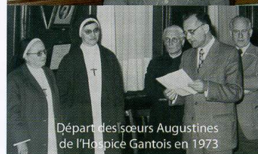
Départ des sœurs Augustines de l'Hospice Gantois en 1973