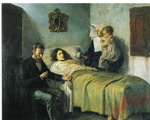
Tableau de Picasso réalisé à l'âge de 15 ans entièrement scénarisé avec le père de Picasso comme médecin et une barcelonaise pour jouer la malade.