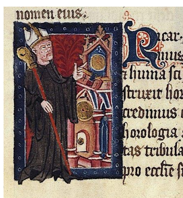
L'abbé Richard de Wallingford défiguré par la lèpre. Enluminure anglaise de 1380.

D'autres aspects qui n'ont pas été développés peuvent faire l'objet d'une autre présentation.