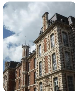
Hôpital de la Charité