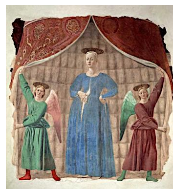
Madone de Piero della Francesca